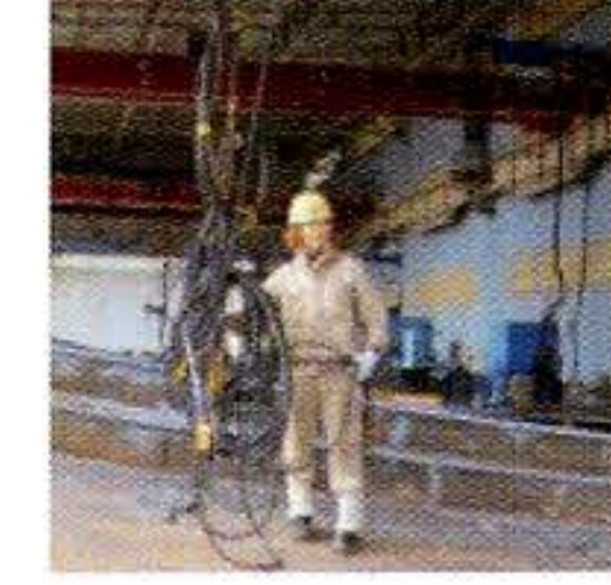
女性の現場登用(現場班長)