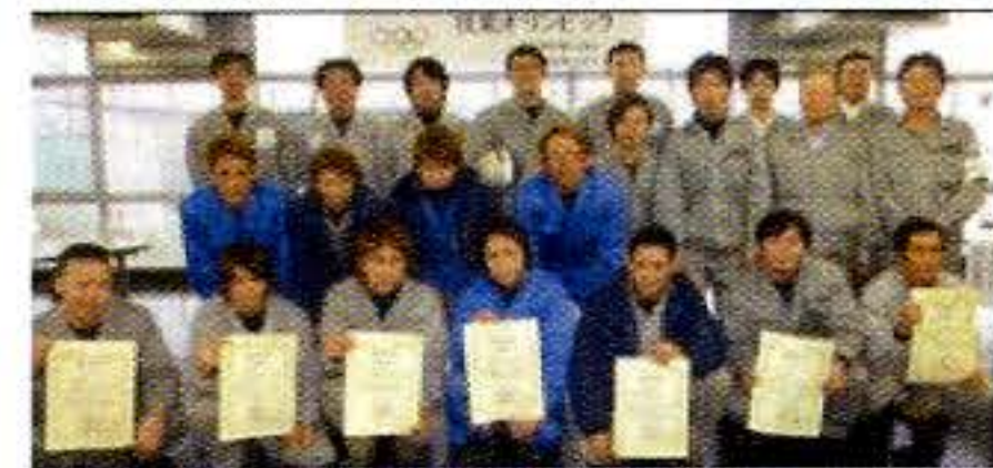
技能大会入賞者の表彰