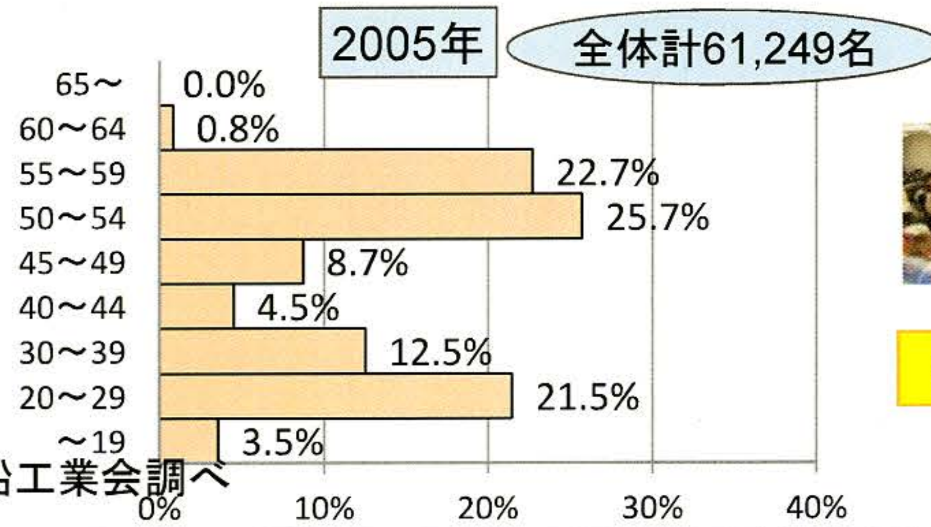
造船技能労働者の年齢構成

平成16年度より、全国6か所の造船技能開発センターにおいて、技能職新人採用者に対して、地域の造船事業者が協力して新人研修を実施(のべ約2,200人が受講)。海事局は16～19年度に約1.8億円を支援。