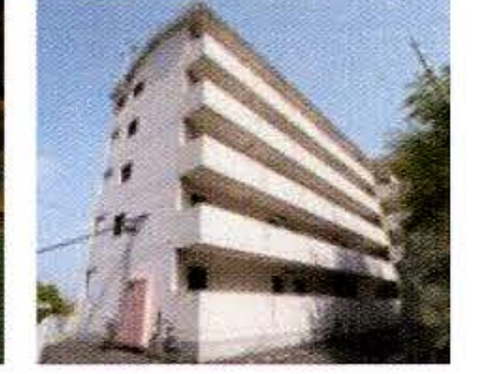
女性用施設の充実