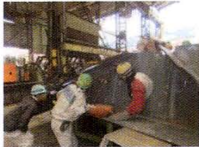
造船技能開発センターにおける専門技能研修(のべ約1,100人が受講)